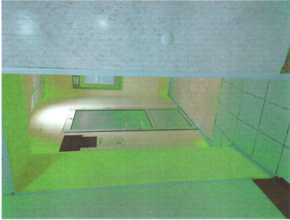
Вход в медиатеку с видом расширенного прохода