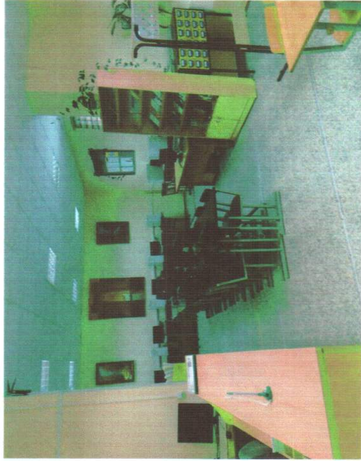
Вход в психологическую лабораторию с видом двери